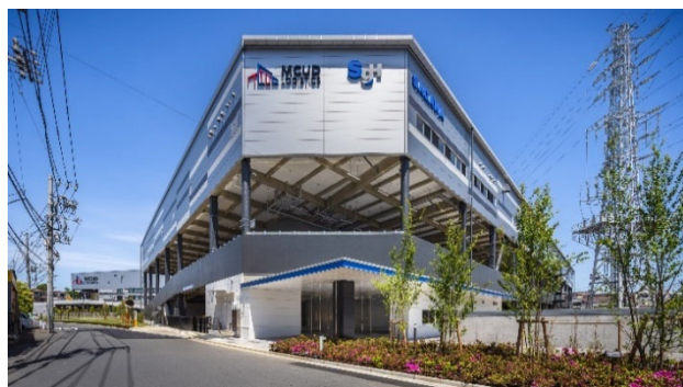
【MCUD・SGリアルティ川崎 外観写真】