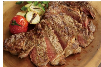
USプライムビーフリップステーキ

URL: http://www.37steakhouse.com/37qualitymeats/