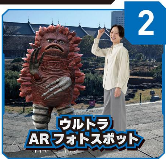
※画像はイメージです。実際のプレイ画面とは異なる場合があります。