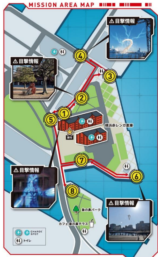
※画像はイメージです。実際のプレイ画面とは異なる場合があります。