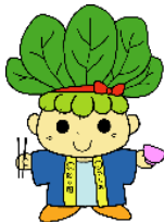
八潮市マスコットキャラクター 「ハッピーこまちゃん」

八潮市は、都心から15キロメートル圏内にある利便性の高いまちでありながら、中川と綾瀬川に囲まれた地形により気軽に水辺空間と親しみ、自然を感じられるまちです。令和6年1月に新庁舎が開庁したことや、令和6年3月から、つくばエクスプレスの快速列車が八潮駅に停車し、市民生活の利便性が大きく向上するとともに、まちづくりの更なる発展が期待されます。また、「共生・協働」「安全・安心」をまちづくりの基本理念として掲げ、市民の皆様が八潮市に住むこと、住み続けることを誇りに思える、「住みやすさナンバー1のまち 八潮」を目指しています。