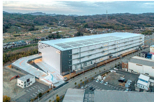
太陽光発電システム