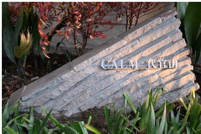
エントランスサイン