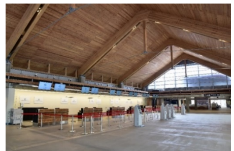
▲（参考）三菱地所におけるCLT使用事例「みやこ下地島空港ターミナル」