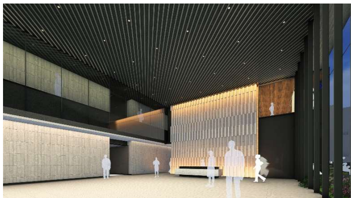
1階オフィスロビー イメージ