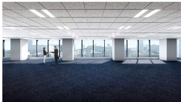
オフィスフロア イメージ