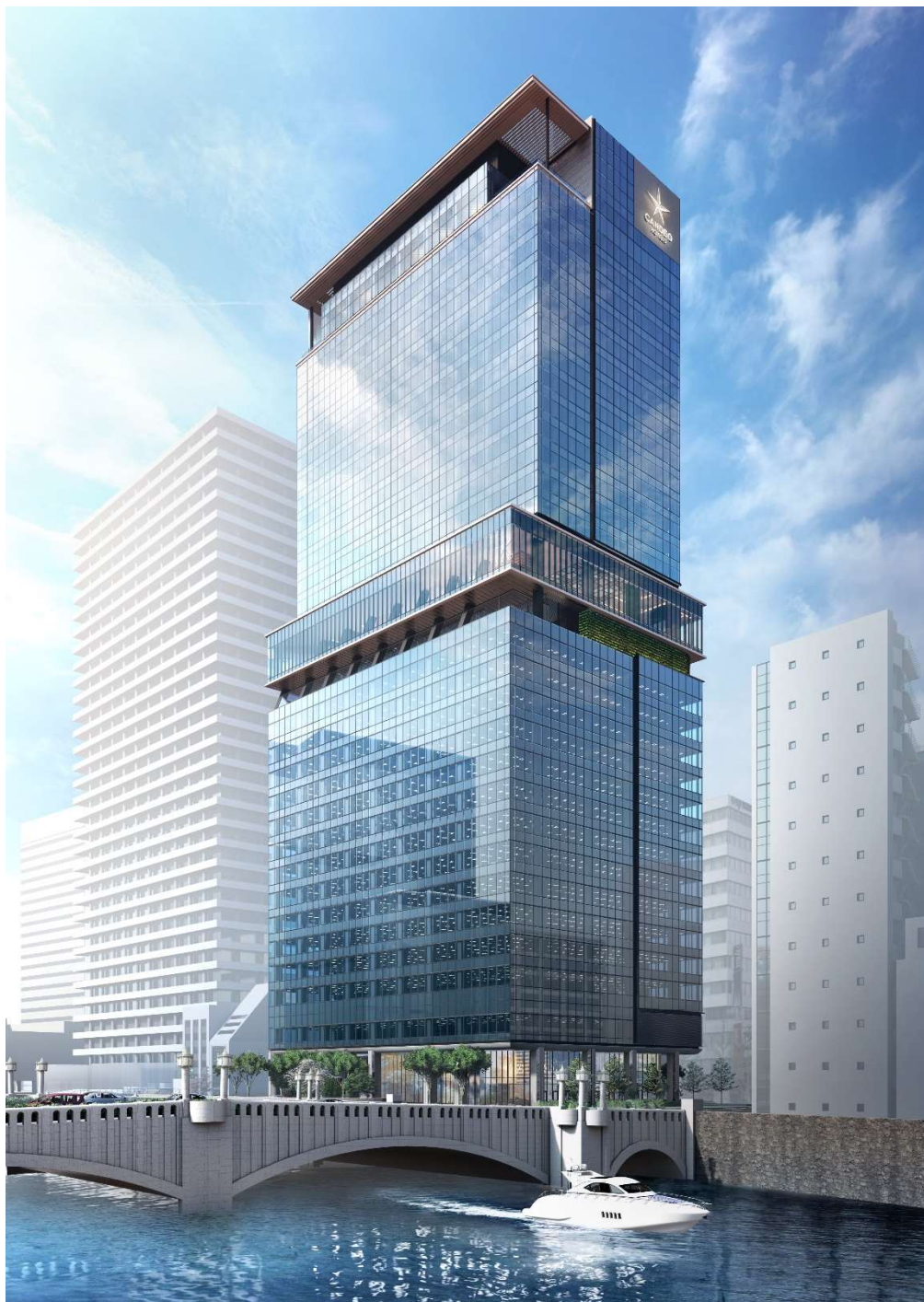
建物イメージ（南東から）